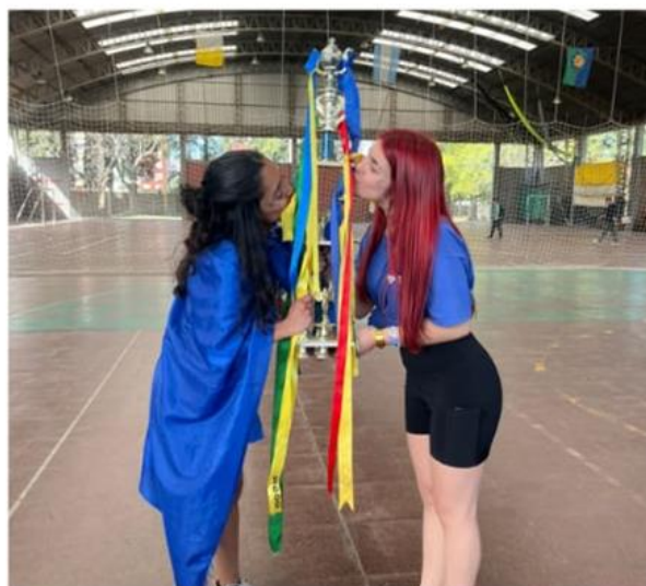
Capitanas del azul con el trofeo.

Que disfruten toda la experiencia, y que el triunfo viene después.