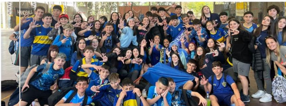
Equipo azul después de ser campeones